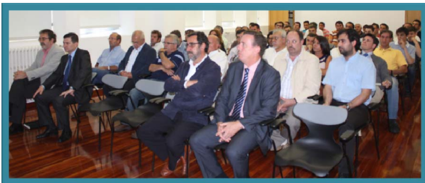
Detalle do público asistente.