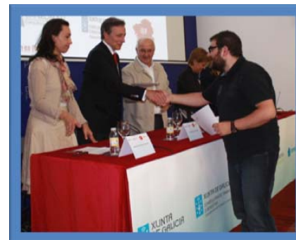
Detalle da entrega de Diplomas

Coñecer o traballo con detalle. Como primeira medida encóntrase a instrución que recibimos ó iniciar as nosas tarefas; como segunda medida, a destreza ó desenvolver a actividade laboral, e finalmente, o coñecemento das nosas limitacións e as do equipo co que traballamos, o que permite decidir con certeza as accións a tomar e por tanto a seguridade laboral.