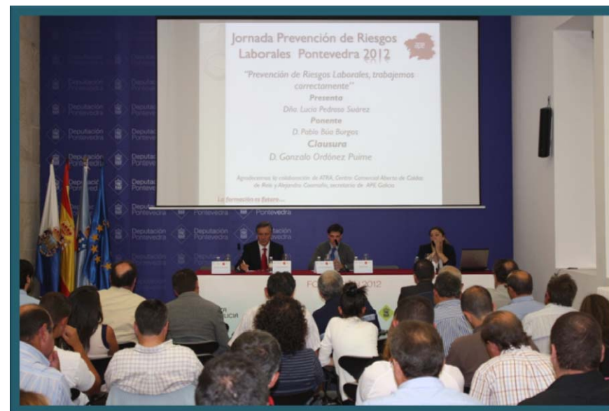
Fotografía do relator durante o evento.

Construír e reforzar una actitude positiva fronte á prevención dos accidentes, punto moi importante á de adquirir unha conciencia baseada na necesidade de traballar coidadosamente para evitar lesións. O problema non é só a falta de información e de formación, senón de contemplar a posibilidade de evitar con facilidade os riscos ó facer algo indebido. Debemos concienciarnos de que ó traballar correctamente evitamos accidentes e lesións, incrementamos a produtividade, a convivencia e a la seguridade do ambiente laboral.